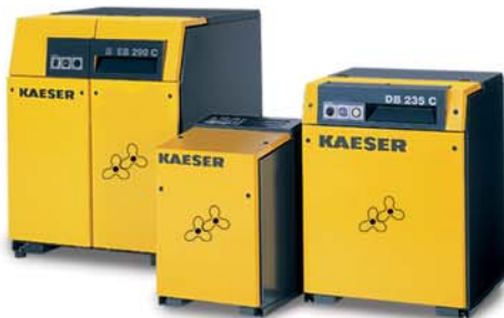
Surpresseurs à pistons rotatifs au PROFIL OMEGA