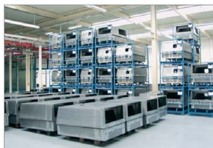
Les carrosseries des compresseurs de chantier sont fabriquées dans la division "Revêtements"