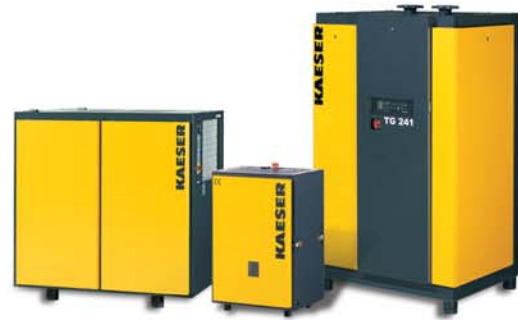
Sécheurs frigorifiques avec la régulation à économie d'énergie SECOTEC