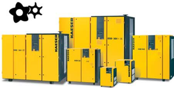
Compresseurs à vis au PROFIL SIGMA