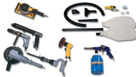
Accessoires pneumatiques/Outillage pneumatique