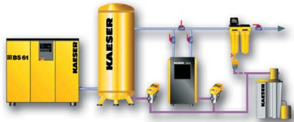
Traitement d'air comprimé (filtres, traitement de condensats, sécheurs par adsorption, colonnes de charbon actif)