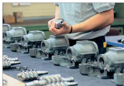
Montage des blocs compresseurs