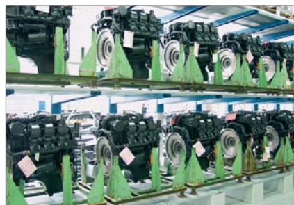
Les moteurs d'entraînement stockés en rayonnage vertical attendent d'être montés