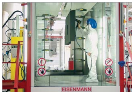
Installation de revêtement par poudre