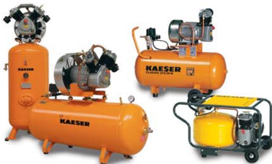
Compresseurs à pistons pour l'artisanat et le bricolage