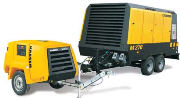
Compresseurs mobiles pour le B.T.P. avec le PROFIL SIGMA