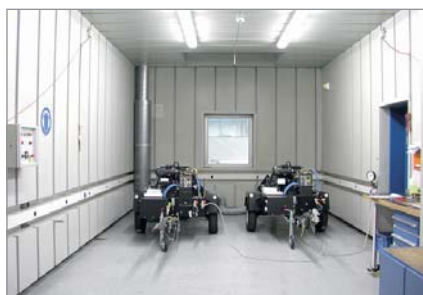
Banc d'essai Mobilair

L'usine de compresseurs pour le B.T.P. à Coburg, siège de KAESER